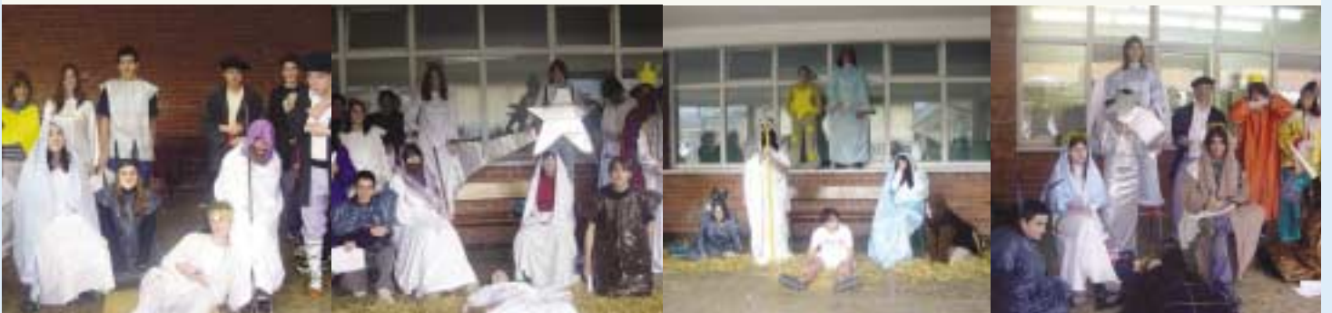
Alumnos y alumnas de 4º de ESO en la representación del Belen Viviente que prepararon en las clases de religión.

Hau guztia frogatzen duten argazkiak hemen dituzue